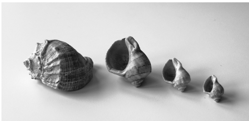
Abb. 1: Vier Schneckenhäuser vom bulgarischen Strand mit Gehäuselängen von 2,5 bis 8,5 cm.